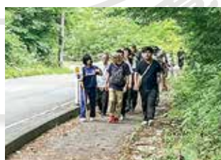
【能代で「ひまわり号走る」事業】