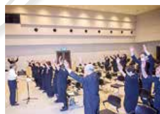
【能代市遺族大会、遺族研修事業】