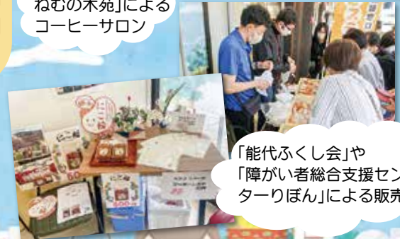
「能代ふくし会」や「障がい者総合支援センターりぼん」による販売