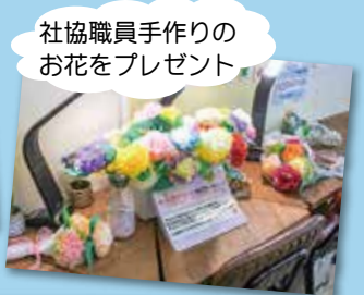
社協職員手作りのお花をプレゼント