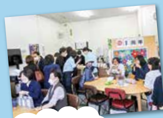
「能代ふくし会 ねむの木苑」によるコーヒーサロン