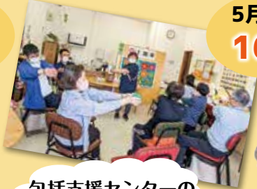
包括支援センターの健康体操