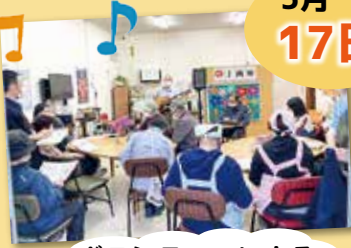
ボランティアによる歌の会