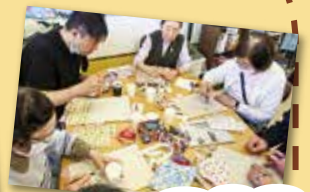
デコパージュ工作